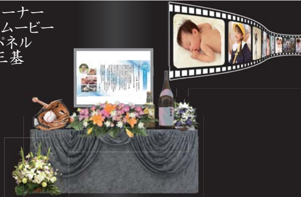
※施行イメージ:額入りの写真や故人の愛用品などをお飾り頂けます