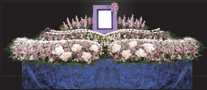
幅:約 3.8m 三段